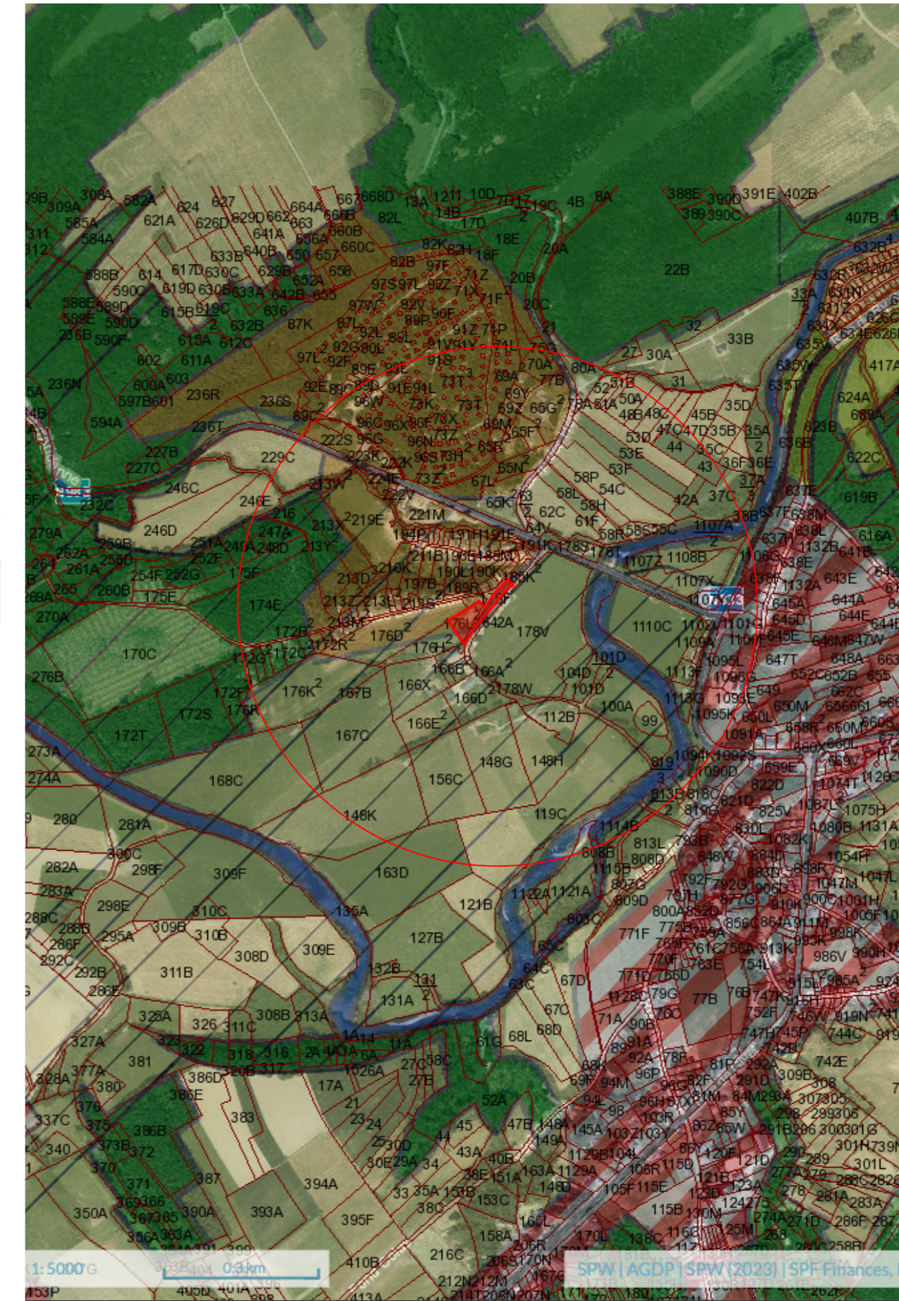
Plan de localisation Ech. : 1:5000